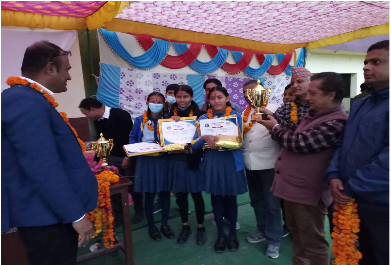
अन्तर विद्यालय हाजिरि जवाफ प्रतियोगिता