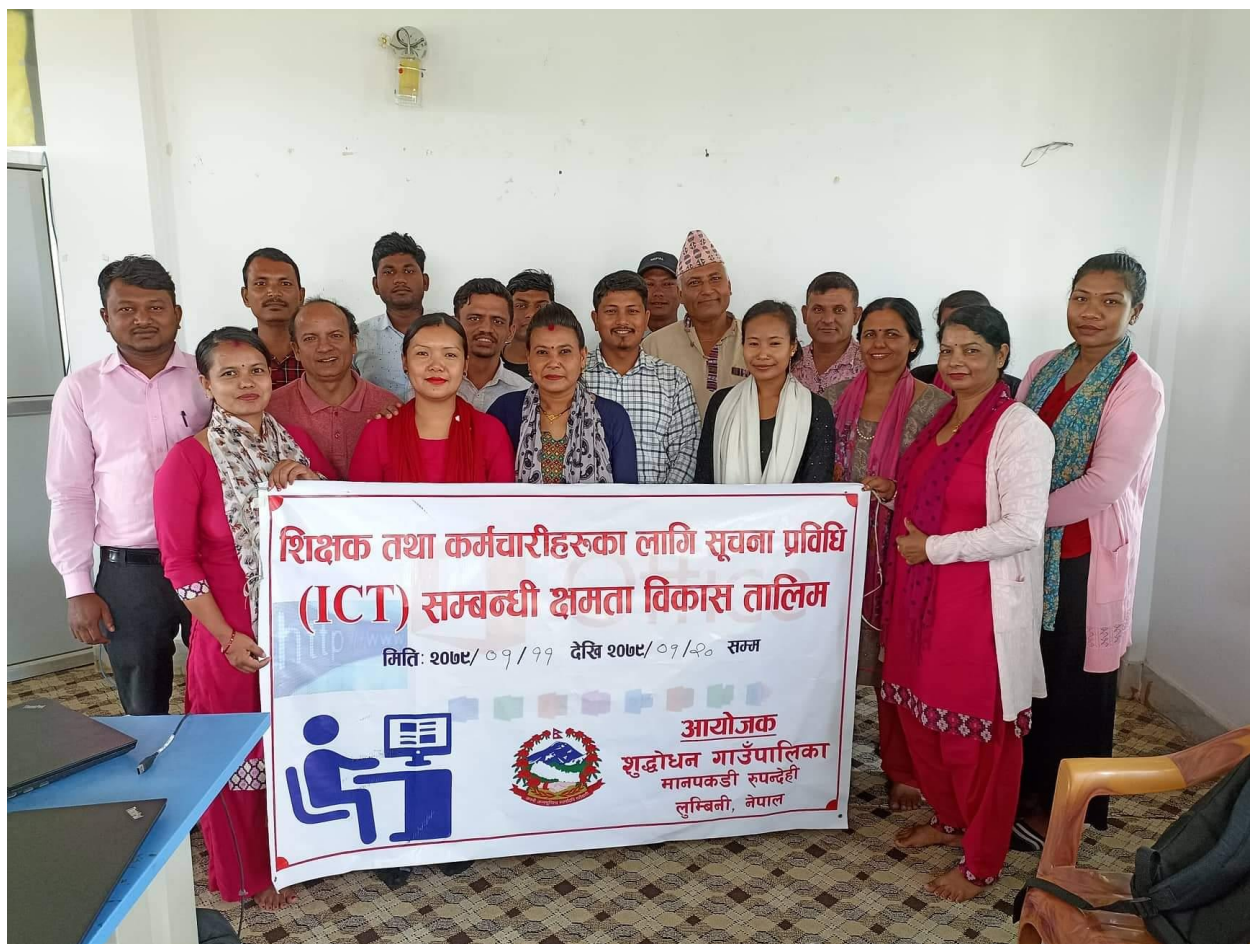
शिक्षक तथा कर्मचारीहरूका लागि सूचना प्रविधि सम्बन्धी क्षमता विकास तालिम