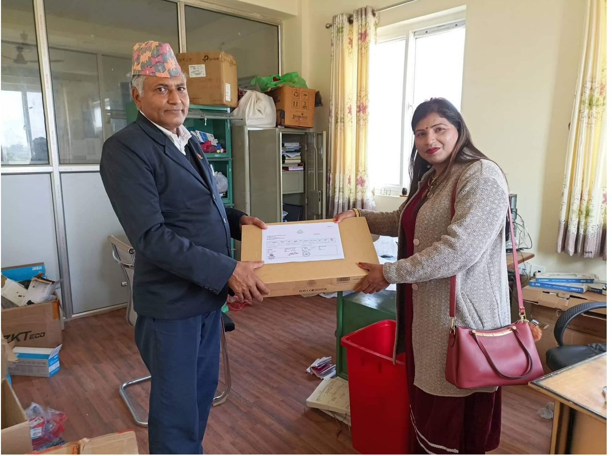
विद्यालयलाई ल्यापटप वितरण कार्यक्रम